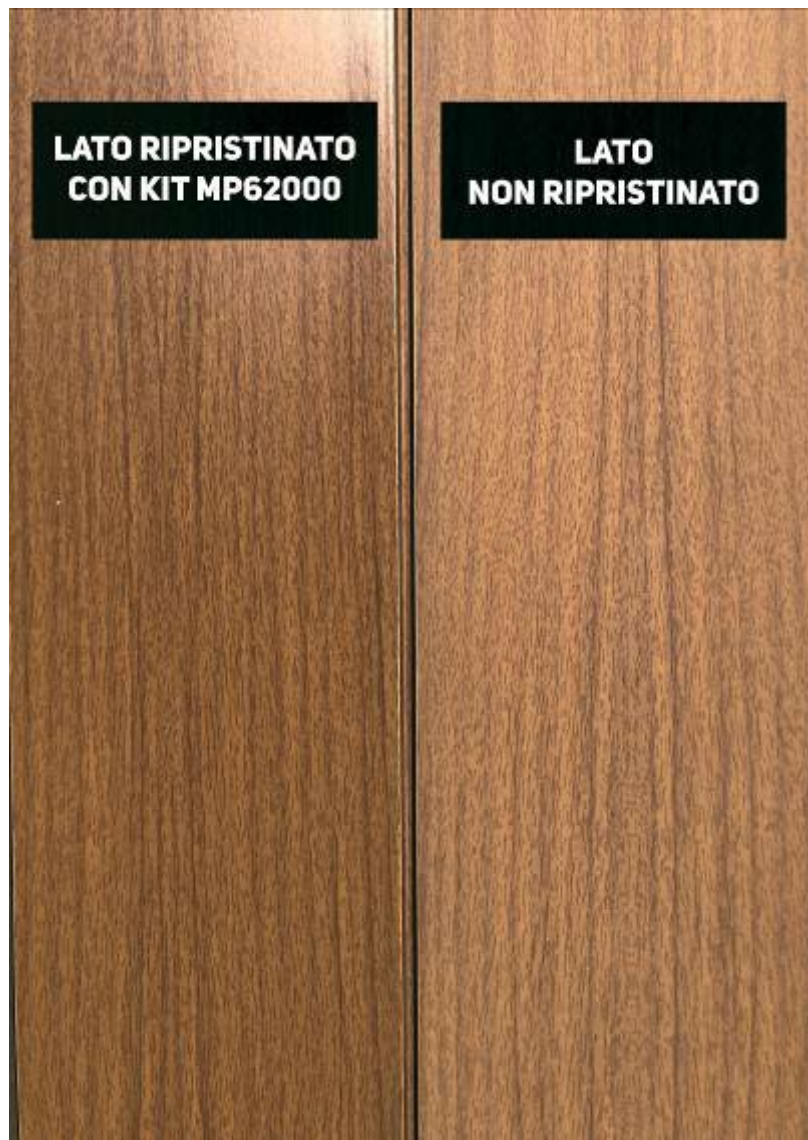
Figura 5: Ingrandimento del PARZIALE ripristino in Figura 4