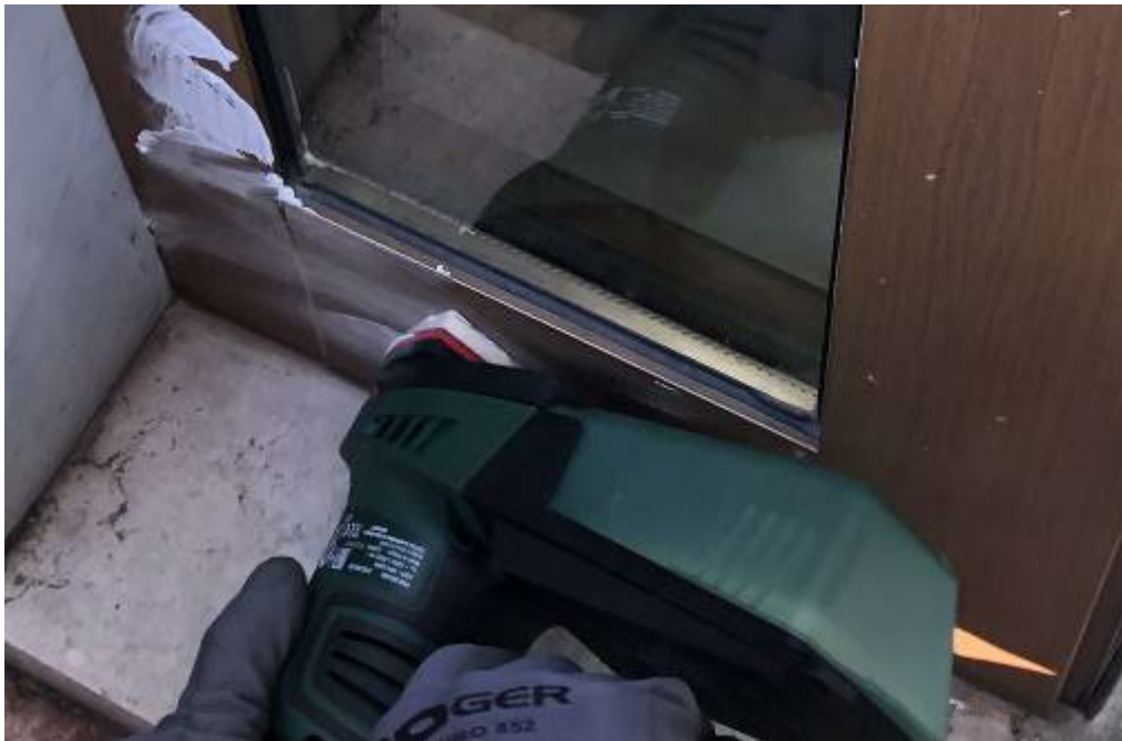
Figura 3: Distensione del PM 02-03-0001 sulla superficie da trattare