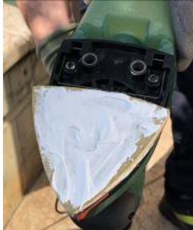
Figura 2: Quantità necessaria del Prodotto PM 02-03-0001 per la superficie da pulire