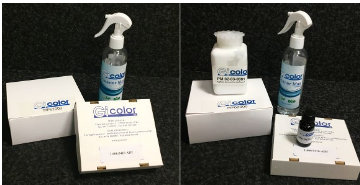
Figura 1: Prodotti contenuti nel Kit di mantenimento

TUTTI I PRODOTTI SOPRA ELENCATI VANNO UTILIZZATI QUANDO LA SUPERFICIE DI APPLICAZIONE RISULTA FREDDA/APPENA TIEPIDA, COSÌ DA EVITARE DANNEGGIAMENTI DA REAZIONE.