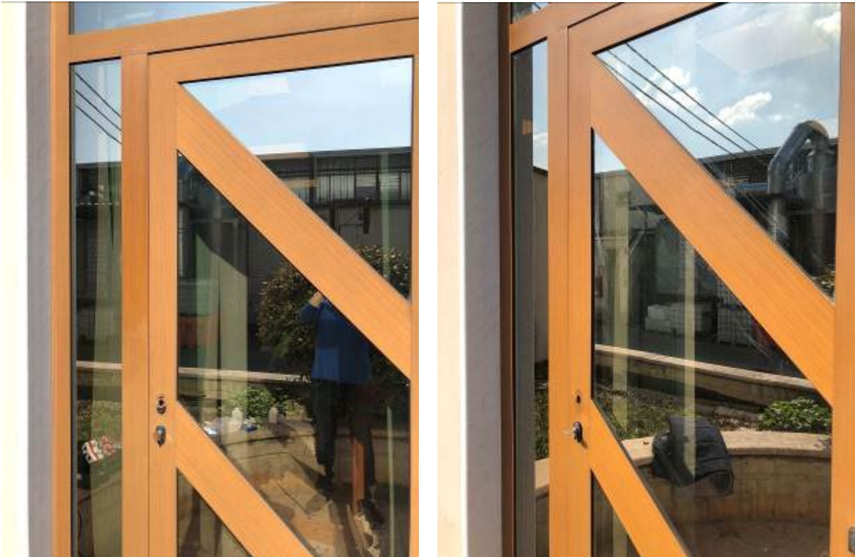
Figura 6: A sinistra porta prima del ripristino; a destra porta dopo il ripristino.

I prodotti all'interno del kit MP62000 possono essere spediti in tutta Italia, Europa e Sud America.